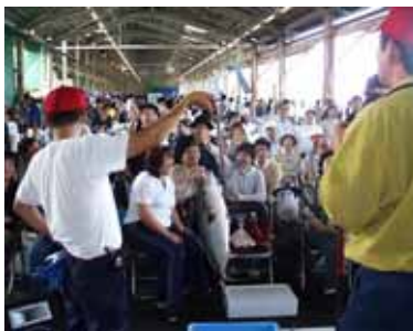
やわたはま海鮮朝市

八幡浜港まちづくり協議会 賑わいある安全安心な港づくりを進めるため平成15年度に設置。官民の各種団体、各層からなる協議会で現在の委員数は31名。