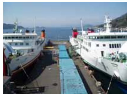
四国の西の玄関口... フェリー利用者は年間約50万人